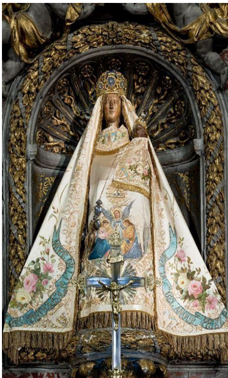
Notre-Dame de Verdélais, Consolatrice des affligés

« Si quelqu'un veut me servir, qu'il me suive ; et là où moi je suis, là aussi sera mon serviteur. Si quelqu'un me sert, mon Père l'honorera. » Jean 12,26