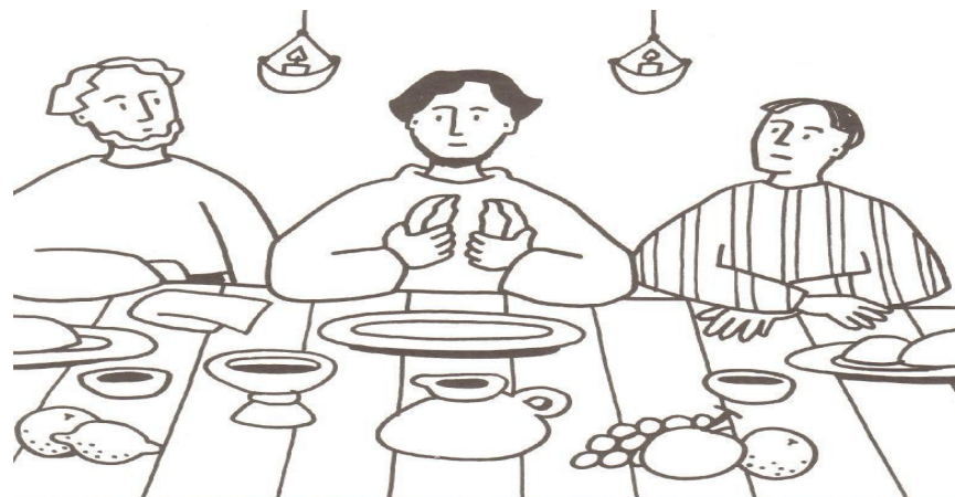
Ceci est mon Corps. Marc 14, 22

Dimanche 7 Juin 2015 – Année B Saint Sacrement du Corps et du Sang du Christ