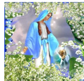
Mois de Mai, mois de Marie Pour marcher avec Jésus

Marche avec nous, Marie, sur nos chemins de Foi, Ils sont chemins vers Dieu, Ils sont chemins vers Dieu.