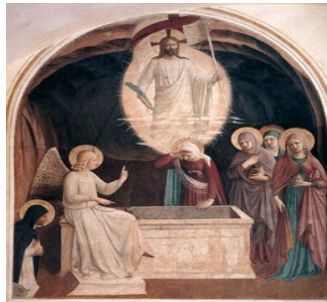
Résurrection du Christ et femmes au tombeau ; Fra ANGELICO ; 1440-41

Jour de Pâques – dimanche de la Résurrection