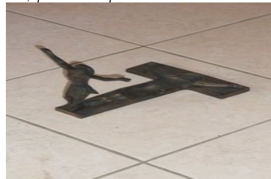
1-La statue "vue du ciel"

Sur cette maquette (qui fait une vingtaine de centimètres de haut et qui est fidèle à la statue originale), on remarque que la statue du Christ Ressuscité ne représente pas simplement "Jésus debout". Il y a également cette sorte "d'empreinte" que le corps du Christ a laissée sur la Croix, qui est posée par terre. Cette photo a été prise pendant le festival des jeunes 2012.